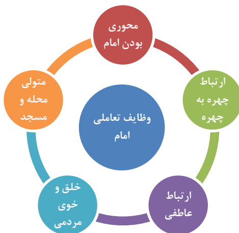
نمودار ۲- وظایف تعاملی امام جماعت