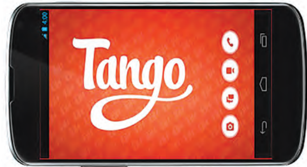
Tango Text, Voice, Video Calls

دگرگونی‌های فراوانی در مختصات فکری افراد می‌شود. ایندیویژوالیسم (Individualism) یا تفردگرایی، مهم‌ترین پدیده‌ای است که این ابزارهای رسانه‌ای و در عین حال سرگرم‌کننده با تغییر در سبک زندگی مردم، باعث گسترش آن می‌شوند.